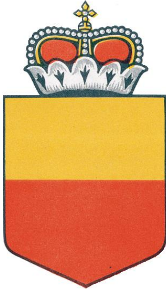
Национальная эмблема Лихтенштейна