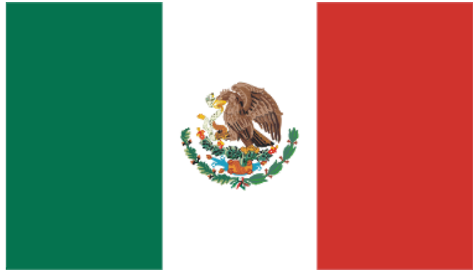
Национальная эмблема Мексики