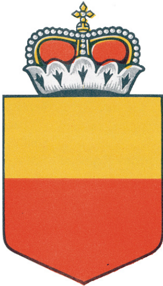
Emblème national du Liechtenstein