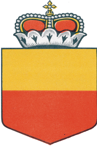
Emblema nacional de Liechtenstein

4. Emblemas nacionales utilizados junto con las marcas de nacionalidad