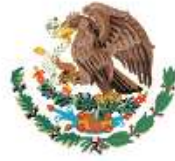
الشعار الوطني للمكسيك