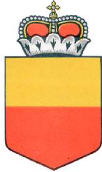
الشعار الوطني لليختنشتاين