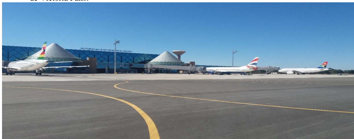
Aéroport international de Victoria Falls Point d'entrée à Victoria Falls

12.1 Transport aérien : L'Aéroport international de Victoria Falls est le point d'entrée dans la ville de Victoria Falls.