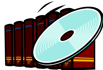
Documentation (Voir IP/2)