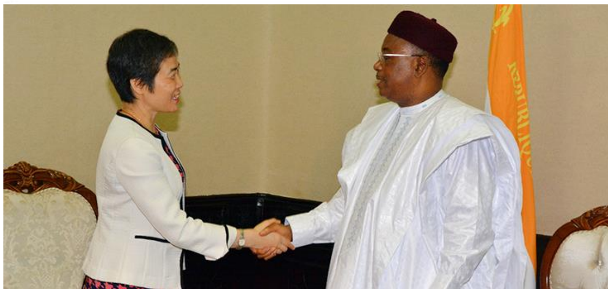
Photo du haut : Au cours de sa mission à Niamey, la Secrétaire générale de l'OACI, Mme Fang Liu, a tenu une réunion bilatérale avec le Président et Chef de l'État du Niger, S. E. Isouffou Mahamadou. Leur entretien a porté sur l'importance stratégique du développement de l'aviation et des investissements dans ce secteur étant donné sa capacité sans pareil d'agir comme catalyseur du développement durable.

Pour l'Organisation, la Semaine de l'aviation AFI était le contexte idéal pour féliciter les représentants de nombreux États pour l'amélioration de leur conformité aux SARP de l'OACI, par l'augmentation des niveaux de mise en œuvre effective, et pour la résolution de préoccupations significatives de sécurité et de sûreté. C'est aussi à cette occasion qu'a été diffusée la quatrième édition du rapport annuel sur la sécurité préparé par le Groupe régional de sécurité de l'aviation – AFI (RASG-AFI).