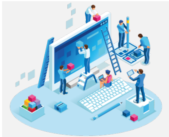
Desarrollo de los Planes de Contingencia ATM