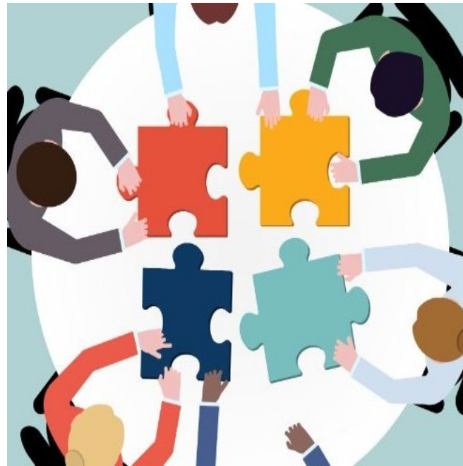
Armonización de los Planes de Contingencia ATM