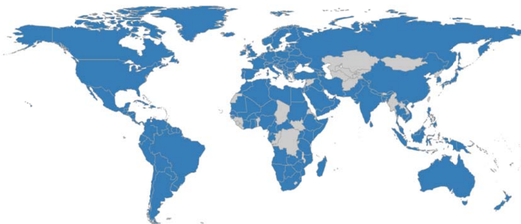
Figura 2. Estados que contactó la Secretaría de la OACI (se destacan en azul)